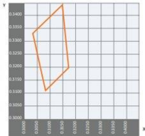
Gráfico de distribución de la luz del módulo Led